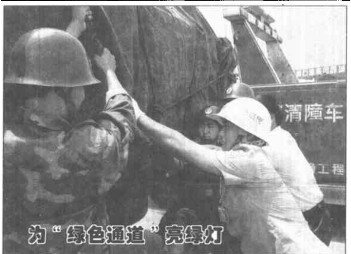
为“绿色通道”亮绿灯

寿光到北京“绿色通道”是经国务院批准确定的、确保首都地区“菜篮子工程”的一条重要运输线。为确保这条道路的安全畅通,市公安局支队以公路路警为主力军,适时在这一路段开展了创建“平安大道”活动,并成立了“绿色通道”施救队,24小时昼夜巡逻,对过往蔬菜运输车辆发生的简易故障,做到及时免费修理,用实际行动迎接建国50周年和澳门回归。图为民警帮助司机加固蔬菜运输车辆。