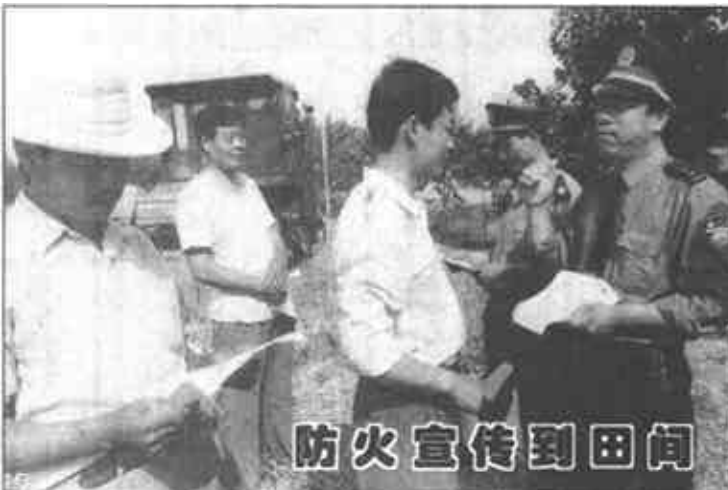
广饶镇派出所为保护三夏生产的安全,印刷《麦田防火》宣传材料若干份,由干警到田间地头发放到农民手中,使农民们增强了麦收防火的意识,真正做到了防患于未然。

广饶讯 西营乡党委、政府增强防火意识,以对人民群众高度负责的态度,精心部署,以防为主,抓好“三夏”防火工作。具体抓了五点,一是落实领导责任制。乡政府把“三夏”期间防火工作责任落实到各单位,实行一把手负责制,谁出现问题就追究谁的责任。二是加大宣传教育力度,通过广播、公开栏、举办讲座等形式,广泛宣传防火知识,增强全民防火意识。三是加大巡查力度。在每个管区都有3—5人组成的防火队伍日夜巡查在村庄、田间、地头,严格控制野外火种和人为破坏。四是清除火患。乡组织人员对各村及麦收场所障碍物进行了清理,特别是对火源、电源近处的易燃、易爆品进行了彻底清理。五是抓防火设施配套。在麦收场所,安装好水泵等防水工具,处于备战状态。(刘国光)